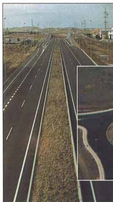
Las obras han supuesto una inversión de 1 084 Mpta.

La obra, a la que se han destinado 1 084 Mpta para su realización y que ha sido cofinanciada por el Estado español y la Unión Europea, supone la construcción de una vía de 2 250 m de longitud y doble calzada, con dos carriles por sentido de la circulación de 3,5 m de anchura y arcenes exteriores de 2,5 e interiores de 1 m, separadas por una mediana variable de entre 7 y 3 m, materializada con barrera de hormigón. Así mismo, se dispone una