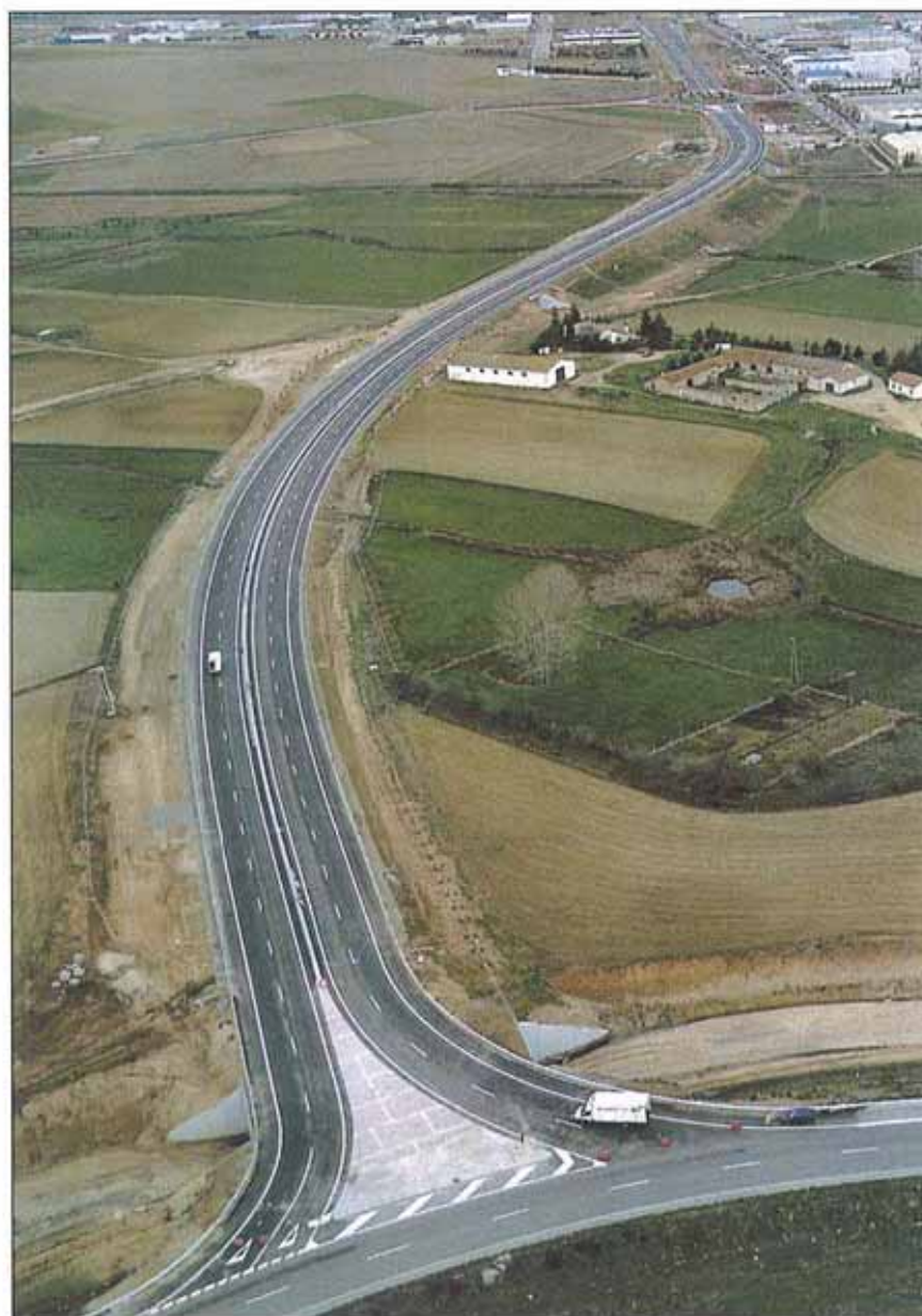
Vista parcial de la obra inaugurada.

Este nuevo tramo refuerza la circunvalación de Salamanca, que se completará próximamente con la construcción de las Rondas Suroeste y Noroeste, desviando el tráfico pesado y aumentando sensiblemente la seguridad de la circulación.